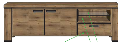
19,2x55x45 Art.39589 60x190x45 21,8x55x45 19,2x55x45