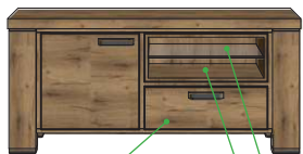
19,2x55x45 Art.39587 60x130x45 21,8x55x45 19,2x55x45