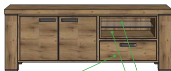
19,2x55x45 Art.39588 60x160x45 21,8x55x45 19,2x55x45