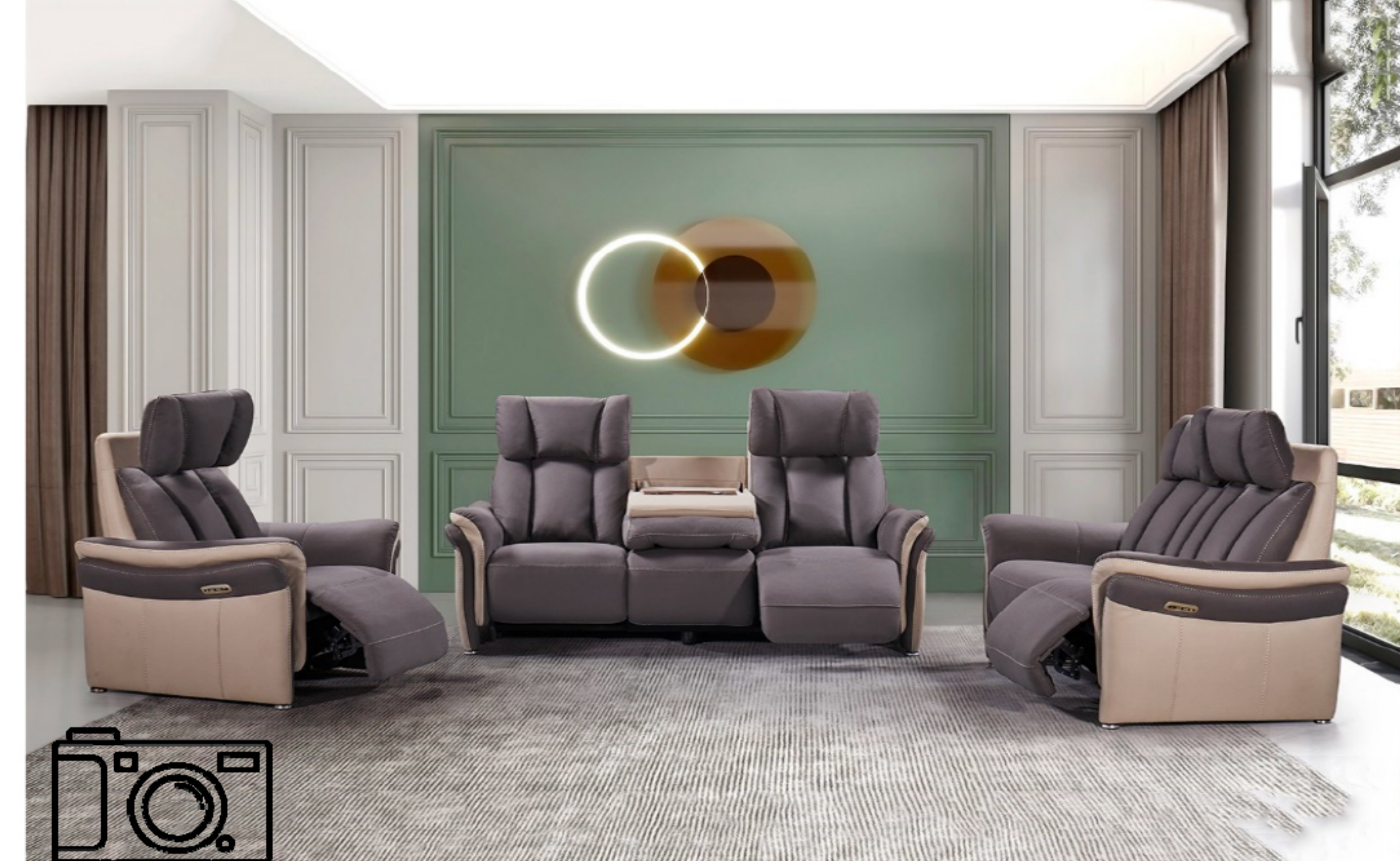
CERGE 6323 - 6805