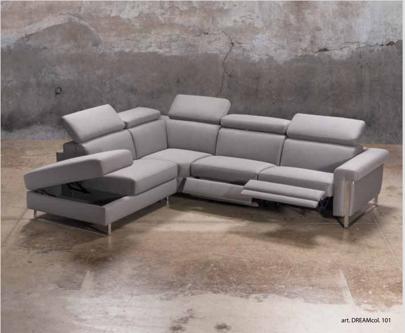
art. DREAMcol. 101