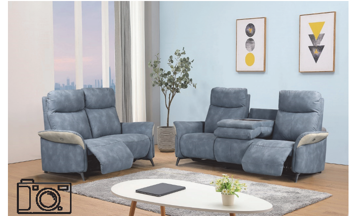
KEMI 03 - 04