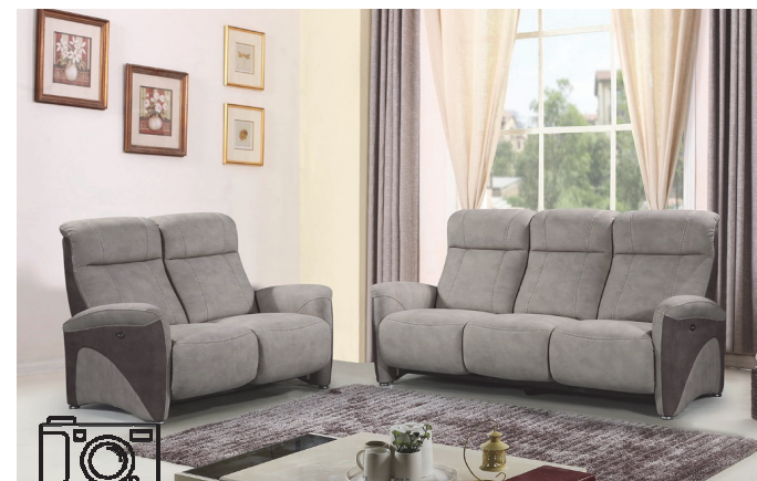
BACH 01 - 06